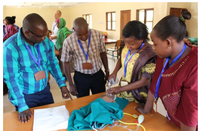
Intubationstraining an einer medizinischen Übungspuppe, Tansania

Die Partnerschaften stärken Gesundheitseinrichtungen, indem sie Komponenten der Gesundheitsversorgung effektiver und effizienter gestalten. Eine Förderung von bis zu 150.000 Euro für den Wissenstransfer durch Training und Fortbildung, Hospitationen und Personalaustausch zwischen den Kooperationsländern, sowie kleinere Begleitforschungsprojekte ist möglich. Zur Verbesserung der Patientensicherheit werden z. B. die Bereiche Qualitätsmanagement, Hygiene, Antibiotikaresistenzen oder Prävention von Epidemien unterstützt.